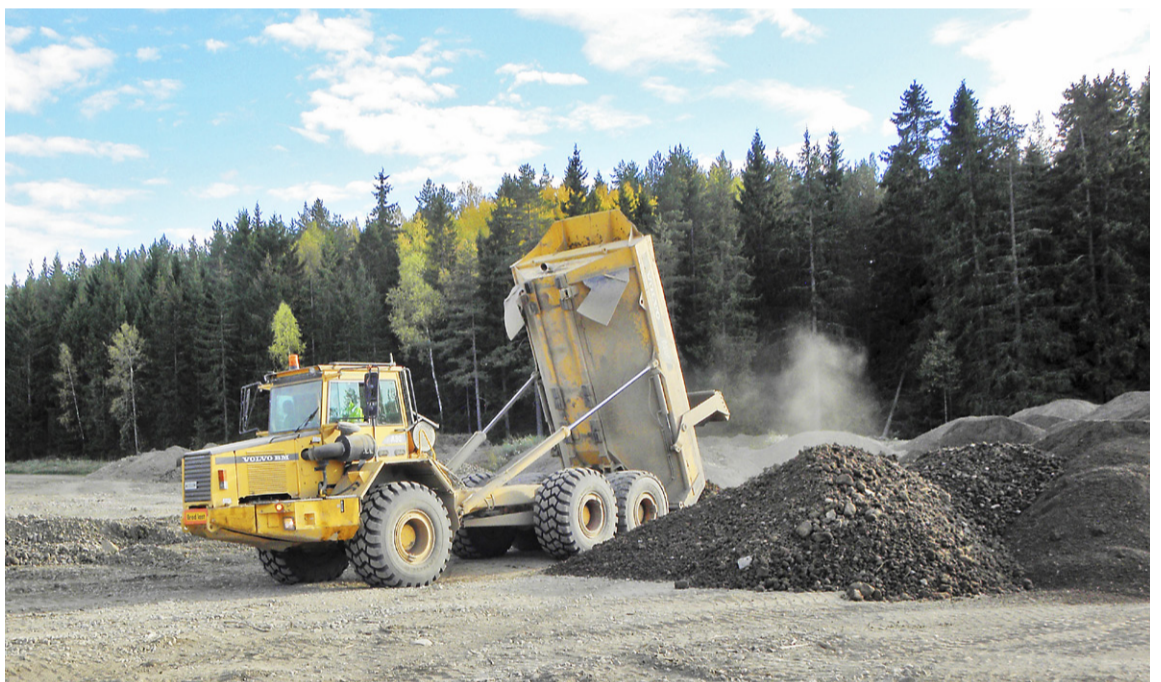
Här tippas jordmassor vid återställningen av lertäkten.