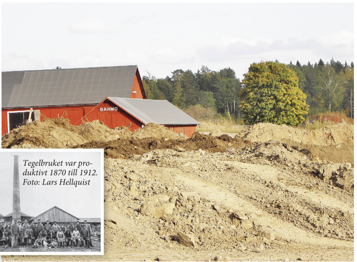
Här, vid gården Bärmö i Sigtuna, pågår återställning av lertäkt till odlingsbar mark.