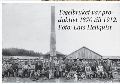
Tegelbruket var produktivt 1870 till 1912.