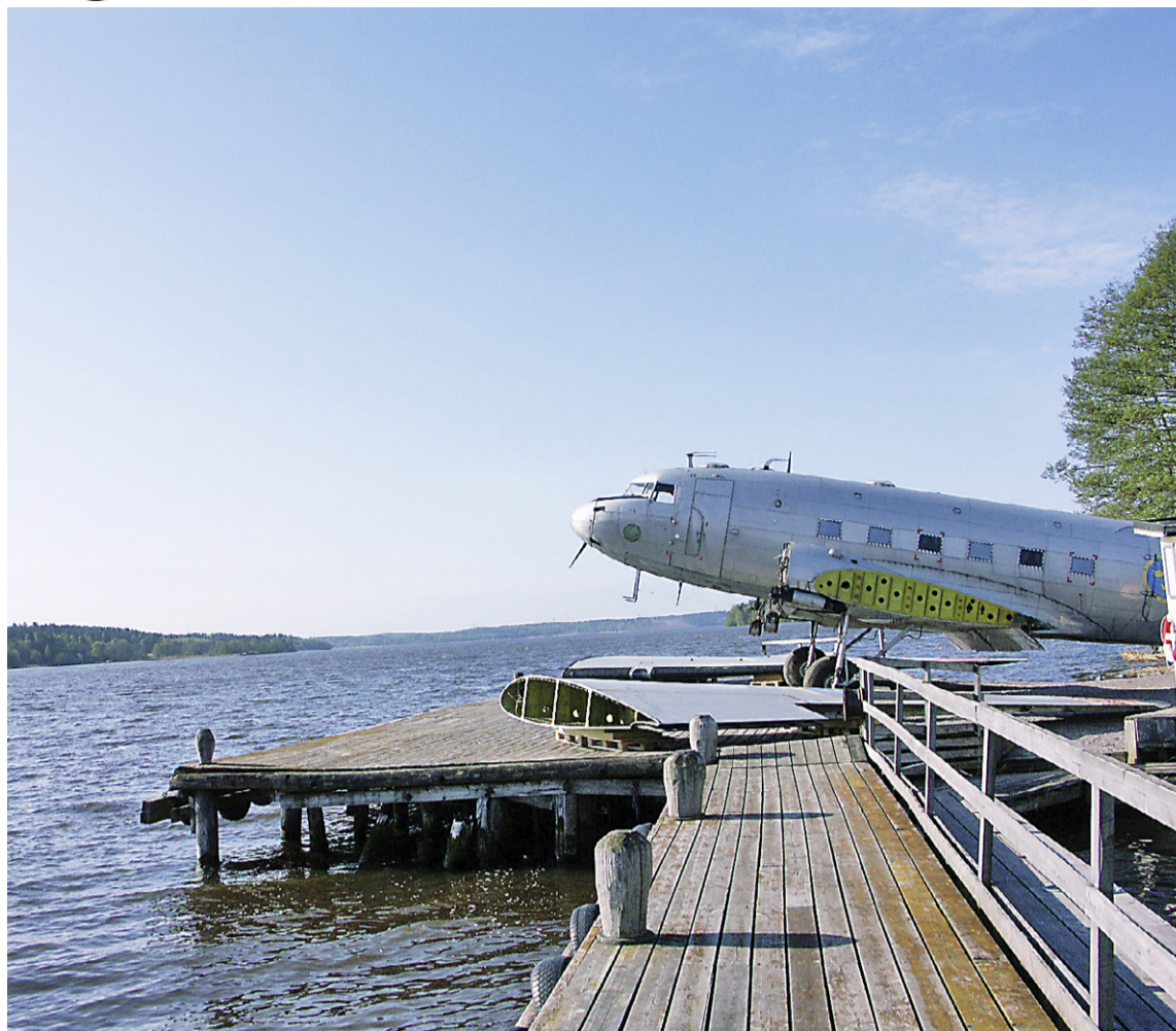
DC-3:an på bryggan, i väntan på avfärd.